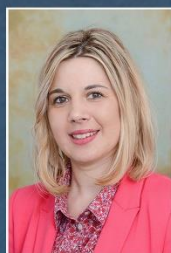
pedagogica Srebrenica Dalida