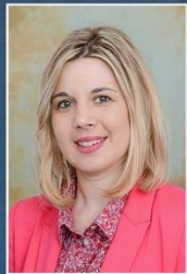
pedagogica Srebrenica Dalida