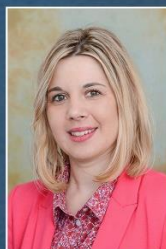
pedagogica Srebrenica Dalida