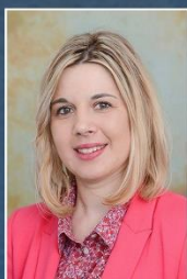
pedagogica Srebrenica Dalida