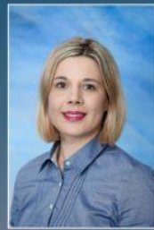
pedagogica Srebrenica Dalida