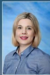
pedagogica Srebrenica Dalida