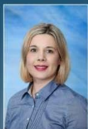
pedagogica Srebrenica Dalida