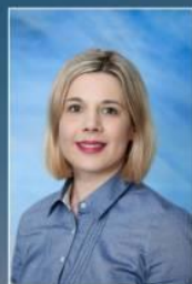
pedagogica Srebrenica Dalida