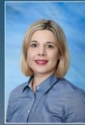
pedagogica Srebrenica Dalida